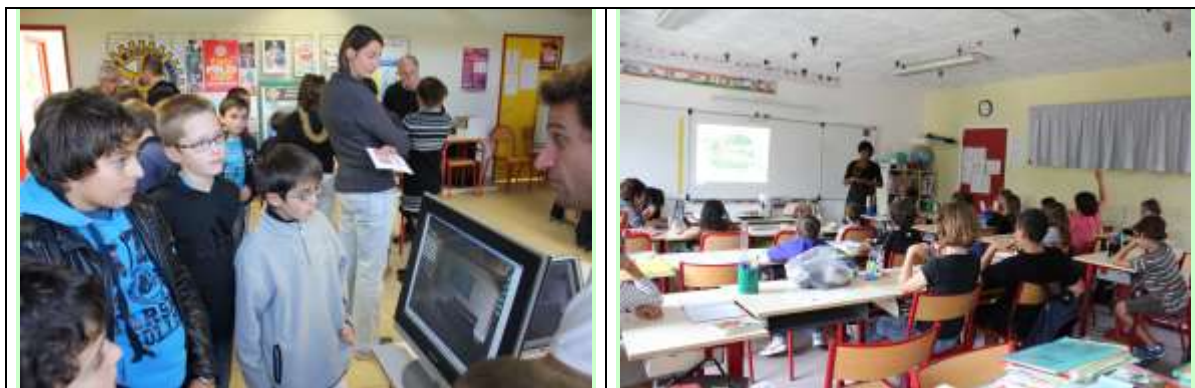
Intervention de KPH dans les écoles