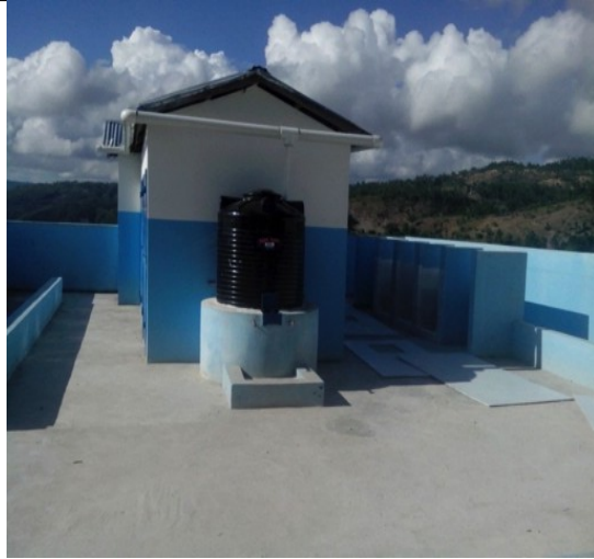
Bloc sanitaire construit par l'ONG Plan Haiti