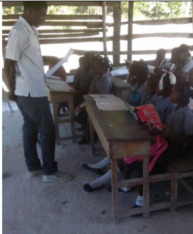
Salles de classes et élèves