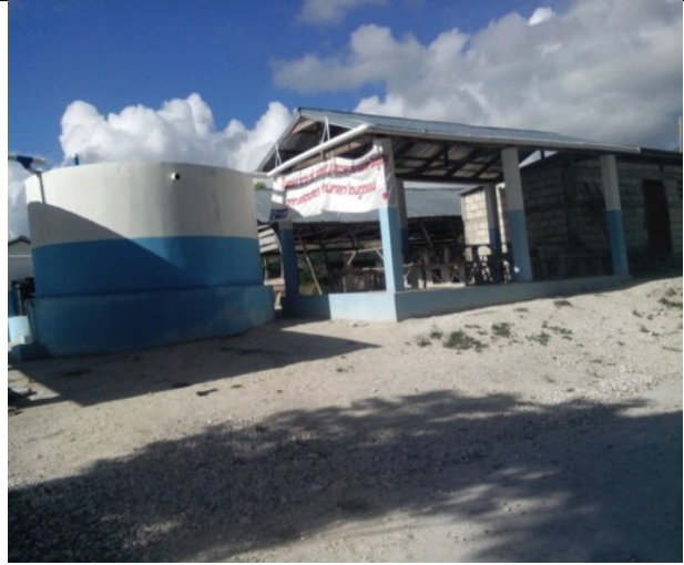
Citerne construite par l'ONG Plan Haiti