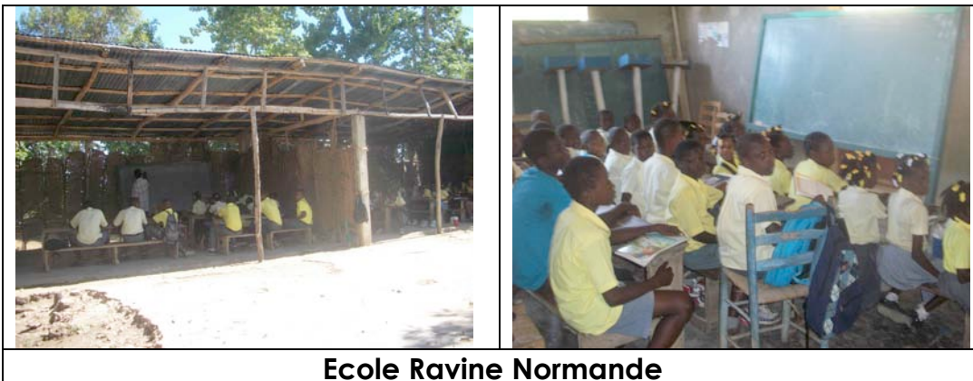
Ecole Ravine Normande