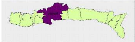
Localisation de la commune dans le département du Sud-Est