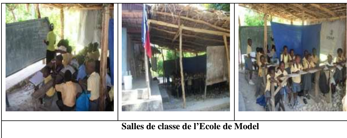
Salles de classe de l'Ecole de Model