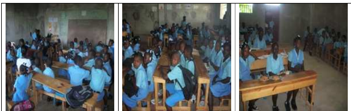
Salles de classe de l'Ecole