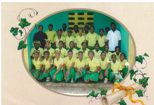
Photo de classe de l'ECM