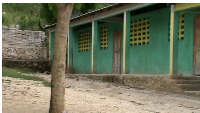
Aile droite de l'ECM

Cher membre de konbit, pour lancer notre programme de parrainage, nous vous faisons parvenir un dossier où vous y trouverez les grandes lignes. Si vous êtes intéressé, renvoyez nous le formulaire de parrainage ci-joint et surtout, parlez en et diffusez le autour de vous !